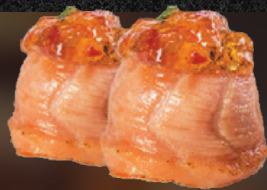
DYO DE POLVO 🐙

Salmão flambado, polvo empanado, geléia de pimenta, cebolinha e molho tarê