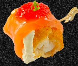
DYO MILANI 🍤🍣

Salmão flambado, camarão empanado, cream cheese, cebolinha, geléia de pimenta e molho tarê.