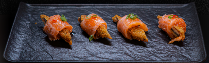
DYO DO CHEF 🍣

Salmão skin empanado, salmão flambado, tabasco, molho blend tai/tarê e cebolinha.