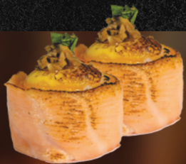
DYO DE CODORNA

2 unid. 4 unid. 6 unid. 25,90 49,90 57,90