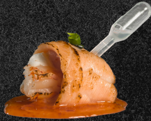
DYO EBI PREMIUM 🍤🍣

Salmão flambado, camarão cozido, cebolinha, cream cheese, molho tai, tarê e ampola com limão espremido.