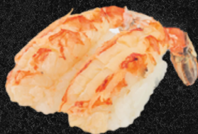
NIGUIRI DE CAMARÃO