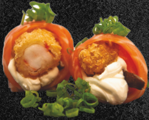
DYO EBI 🍤🍣

Filé de salmão envolvido no camarão empanado, shiitake, cream cheese, tabasco, cebolinha e molho tarê.