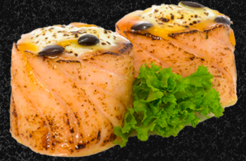
DYO DE MARACUJÁ

Filé de salmão flambado envolvido no arroz, cream cheese e molho de maracujá.