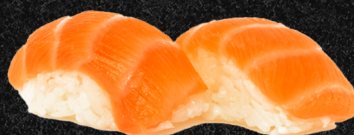
NIGUIRI DE SALMÃO