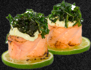
DYO GUNKAN DORI

2 unid. 4 unid. 6 unid. 25,90 49,90 57,90