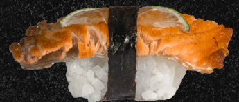
NIGUIRI SKIN LEMON

Pele de salmão grelhada, arroz, nori, limão, gergelim e molho tarê.